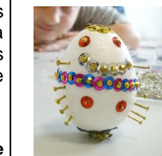
Bonhommes en clous